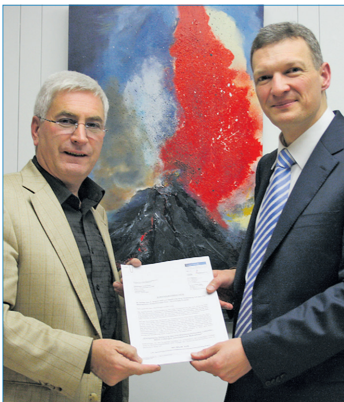
Oberbürgermeister Klaus Lorig (links) und Innenminister Stephan Toscani bei der Übergabe des Zuwendungsbescheides

verwaltung. Völklingen sei damit eine der ersten Städte im Saarland, die alle zwölf Bescheide zu Projekten aus dem Konjunkturpaket erhalten habe. „Durch diese Gelder können wir endlich u. a. unsere Pläne in die Tat umsetzen, die Stadionstraße zu verlegen und im Bereich der neuen Einmündung in die Püttlinger Straße einen vierarmigen Kreisverkehrsplatz aufzubauen“, freute sich Oberbürgermeister Klaus Lorig. Es sei zu erwarten, dass sich der Verkehrsfluss stadtauswärts in Richtung Püttlingen durch diese Baumaßnahmen erheblich verbessern und sich die Verkehrssicherheit eindeutig erhöhen werde.