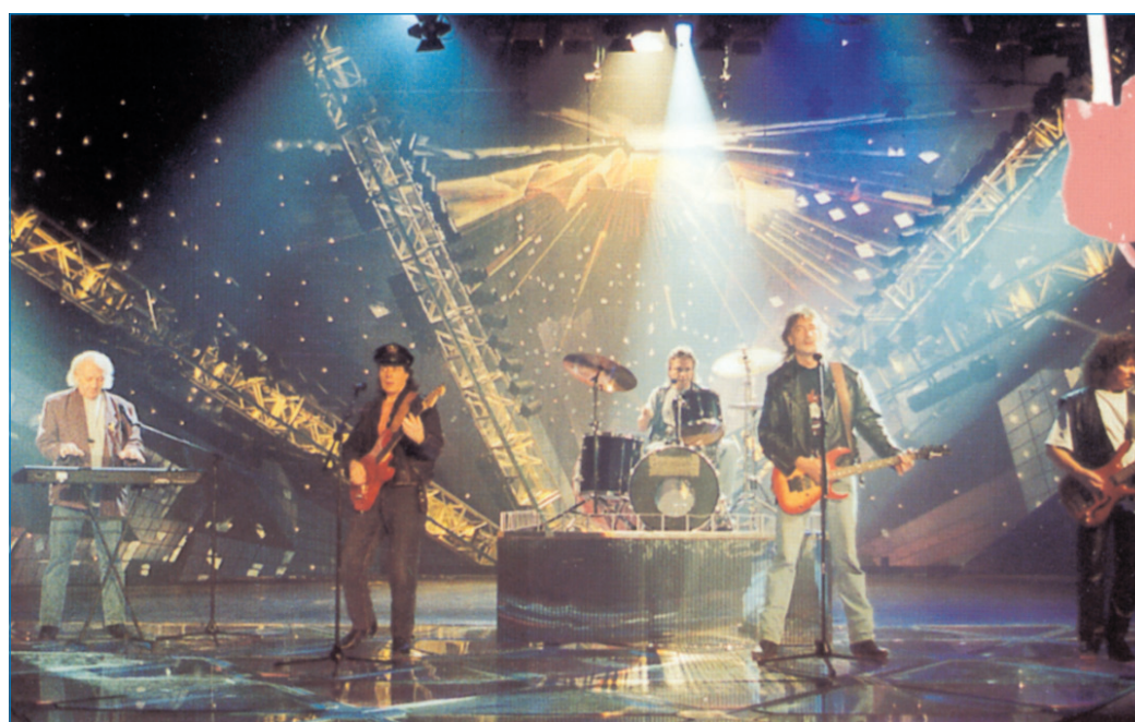
Die Puhdys: Die Ex-DDR-Band kommt nach Völklingen

Begleitband für das Konzert der PUHDYS ist L.U.N.A.T.I.C. Die saarländische Formation, die bereits zwei eigene Alben produziert hat, wird schon seit einiger Zeit als Geheimtipp unter Fans guter, handgemachter